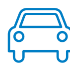
INTÉRIEUR DE VÉHICULES